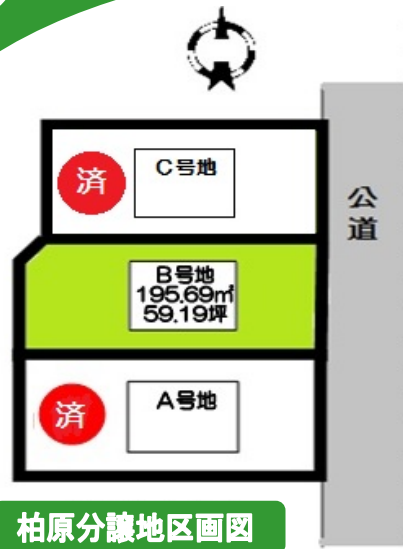
柏原分譲地区画図

◇土地面積:195.69㎡(59.19坪) ◇建物面積:103.50㎡(31.30坪) 1F:55.48㎡/2F:48.02㎡